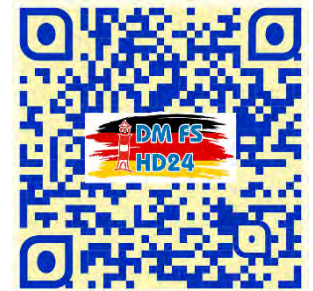
DM FS HD - AT

Für die zusätzlichen Angebote bitten um Deine separate Anmeldung Sag uns was du brauchst, welche Infos dir noch fehlen