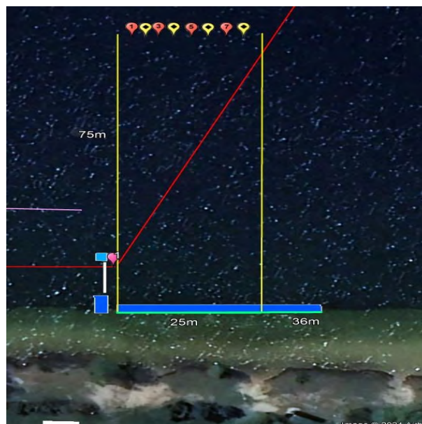
Abbildung 2: Wettkampfgebiet für 150m ER FS